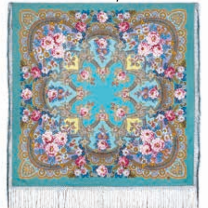
Шаль «Зима». Шерсть. 148x148