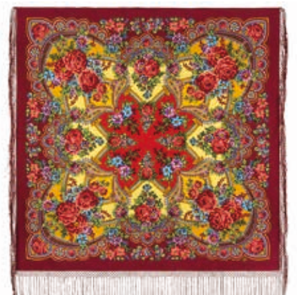
Шаль «Лето». Шерсть. 148x148