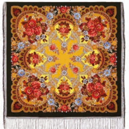
Шаль «Осень». Шерсть. 148x148