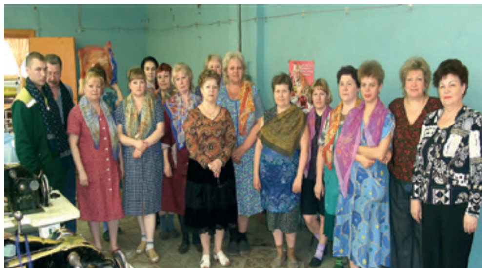
На снимке: победители и участники конкурса рабочего мастерства бахромно-наметочного участка "ППМ" и члены конкурсной комиссии